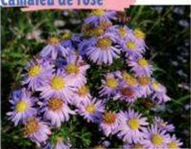
Aster lancéolé, une invasive à ne pas confondre avec Aster amelle