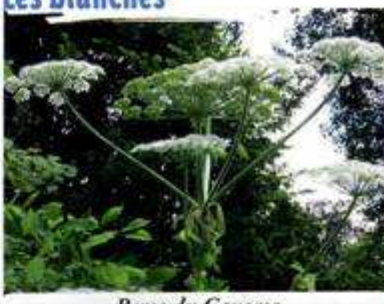
Berce du Caucase